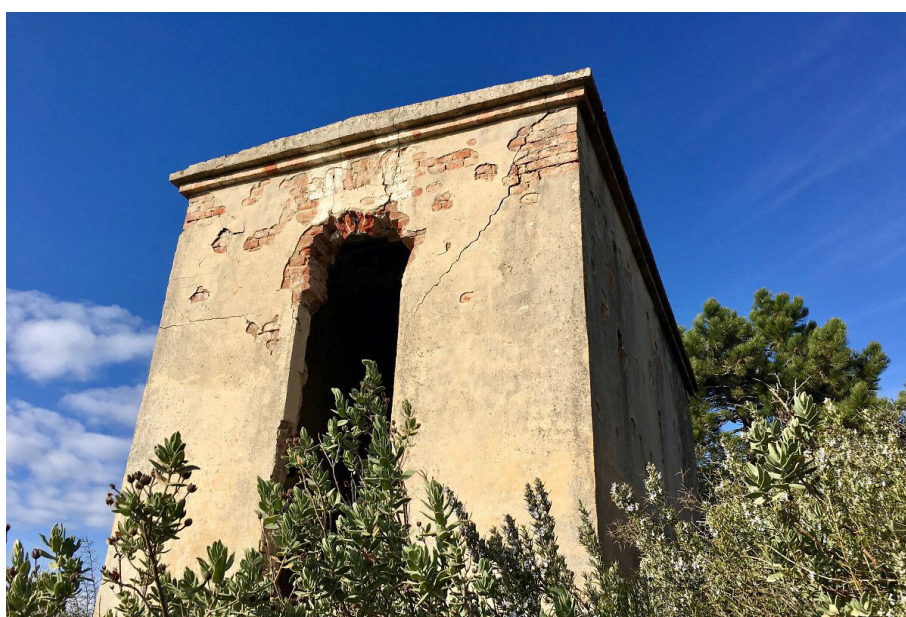
La Mire de Cantaron