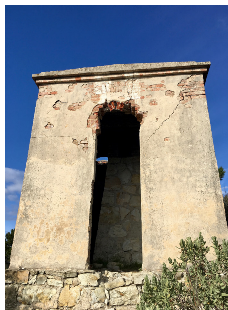
La Mire du Mont Macaron à Cantaron et son viseur